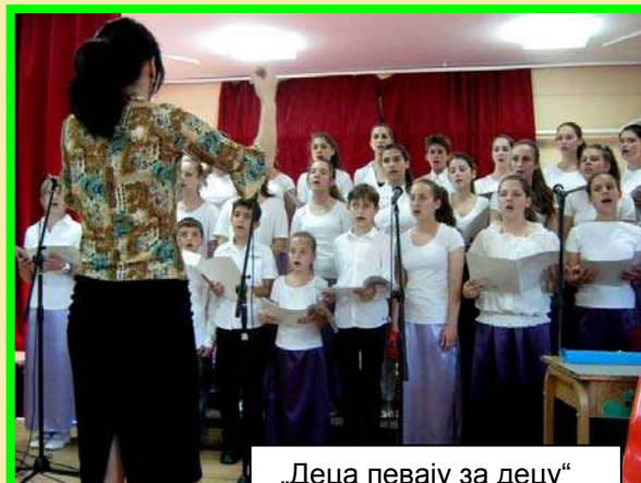
„Деца певају за децу“ 5. јуна 2014. године