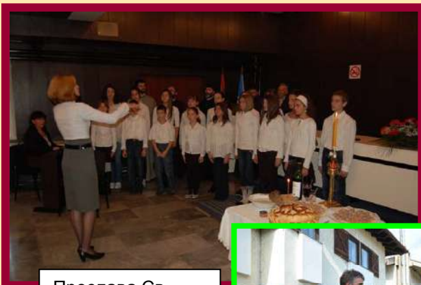
Прослава Св. Петке у општини Гроцка