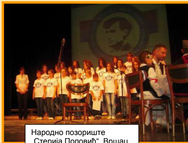
Народно позориште „Стерија Поповић“, Вршац