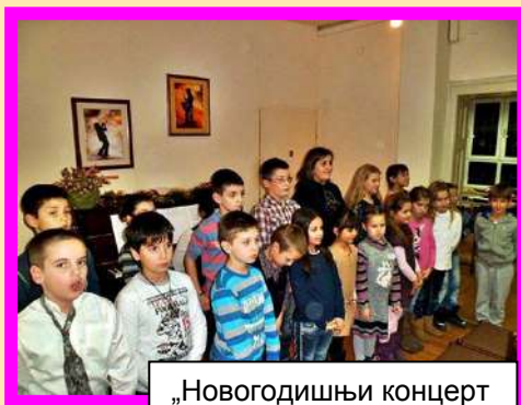
„Новогодишњи концерт првака“ у нашој школи, децембар 2013. године