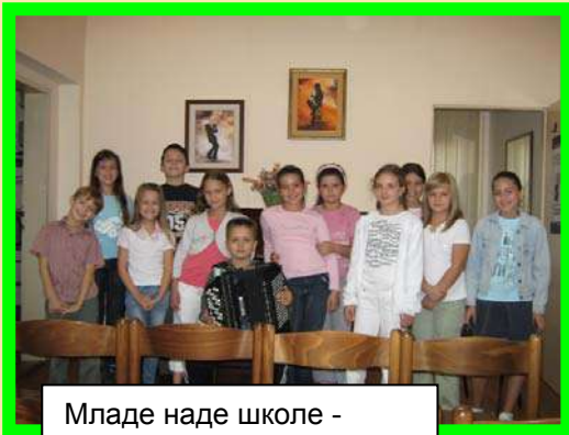
Младе наде школе - са концерта за децу из вртића „Лане“ 2009.

и релативно малог искуства у раду са децом, постигли изванредне резултате на поменутиим такмичењима. Школа свакога децембра организује школско такмичење инструменталних класа и у марту месецу школско такмичење из солфеђа под називом „Волим солфеђо“ за ученике школе.