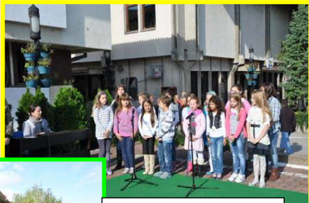
„Трка мира“, плато испред општине Гроцка