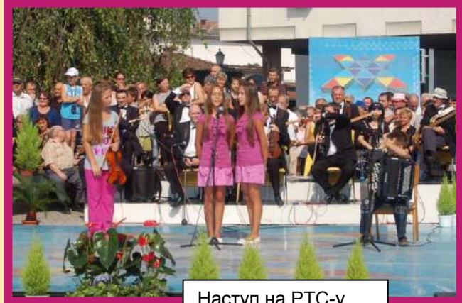
Наступ на РТС-у "Жикина шареница"