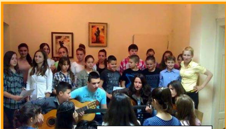
„Хуманост на наш начин“ 30. мај 2014. године