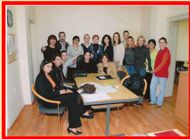
1. октобар 2007. - први дан у својој згради

Од наших почетака до данас прешли смо дуг пут улажући у смештајне капацитете, инструменте, наставни кадар, али и у очување јединственог духа који се овде формирао дајући осећај другог дома свим нашим запосленима и ученицима. Многи од наших бивших ученика данас уписују своју децу, а неки од бивших ђака, који су се посветили професионалном музичком образовању, чине наш наставни кадар и жеља нам је да их буде још више.