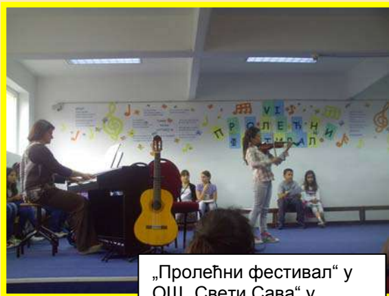
„Пролећни фестивал“ у ОШ „Свети Сава“ у Врчину