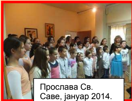
Прослава Св. Саве, јануар 2014. мали и велики хор