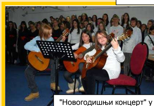
"Новогодишњи концерт" у ОШ "Свети Сава" у Врчину децембар 2013. године