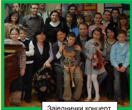
Заједнички концерт у Младеновцу