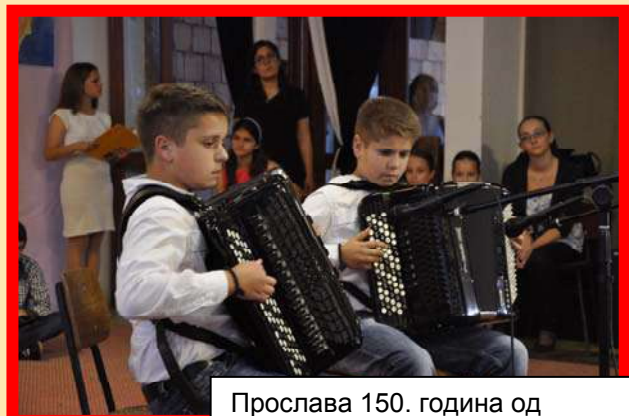
Прослава 150. година од оснивања школе „Мића Стојковић“ у Умчарима