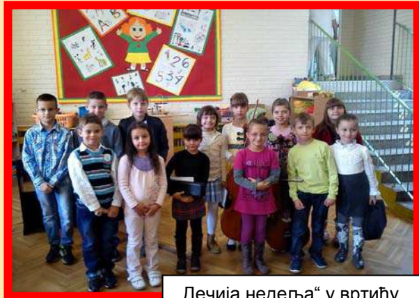
„Дечија недеља“ у вртићу „Лане“ 2013. године