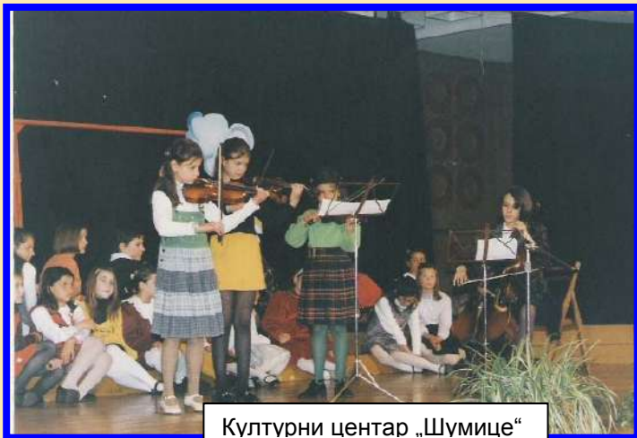
Културни центар „Шумице“