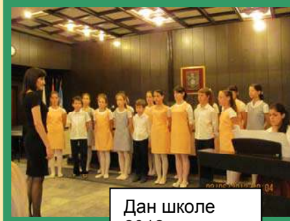
Дан школе 2012. године